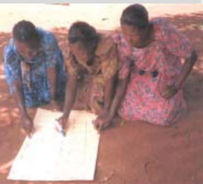
Figure 1. Agriculteurs traçant une carte des flux de ressources.

Ces cartes ont ensuite servi de base à l'analyse des flux de nutriments, réalisée à partir d'une boîte à outils informatique (Defoer and Budelman, 2000)1.