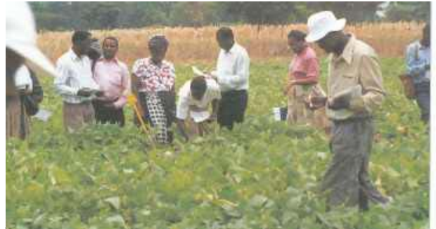
Dans le nord de la Tanzanie, les agriculteurs croyaient que la mouche blanche venait avec les pluies et qu'elle ne résistait pas aux fortes pluies. C'est ainsi que la seule solution de contrôle proposée était la pluie.

Les stratégies de lutte les plus rationnelles et les plus efficaces sont rarement mises en œuvre car le processus de formulation et de présentation des recommandations tend à négliger les aspects complexes de la production en petite exploitation agricole. Les agriculteurs sont souvent perplexes face aux maladies du haricot, comme face à d'autres maladies par ailleurs : pour certains, la chrysalide de la mouche du haricot est une fourmi, pour d'autres les mouches blanches arrivent avec les pluies. Dans ce contexte, les techniques complexes ne font souvent qu'ajouter à la confusion. La démarche du CIAT en matière de mise au point et de diffusion de nouvelles techniques s'attache entre autres à aider les agriculteurs à mieux comprendre le problème et à exploiter leur savoir. Le présent numéro des Temps Forts décrit une approche adaptative de la mise au point et de la diffusion des techniques de lutte intégrée contre les ravageurs, expérimentée avec des petits agriculteurs du nord de la Tanzanie.