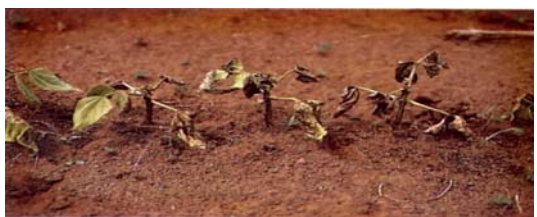
Dommages causés par la mouche blanche (en haut) et par la mouche du haricot (en bas).

discussion des solutions envisageables et des stratégies destinées à les tester.