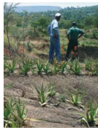
ICRAF, T. Terhoeven-Ursemans

Através da AfSIS, o Instituto TSFB e seus parceiros esperam que o lugar-comum e a rotina se tornem numa experiência instrutiva, à semelhança do que aconteceu com a formulação da proposta do projecto. O Ministro da Agricultura do Malawi solicitou orientação para aumentar a eficiência da utilização de adubos ao