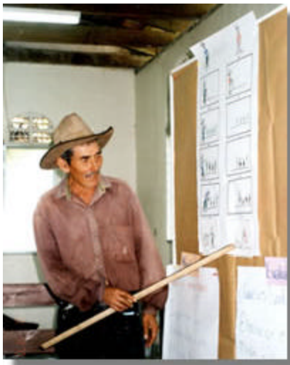
Agricultor Hondureño , explicando los conceptos principales del S&EP.

Como resultado de la interacción entre Instituciones en los encuentros de Seguimiento y Evaluación y al diplomado, IPRA y Smurfit Carton de Colombia maduraron un proyecto en el que CORFOCIAL como expertos en el manejo de las metodologías participativas tendría la responsabilidad de facilitar el establecimiento de CIAL's en zonas de producción forestal para fomentar la diversificación de la producción agropecuaria involucrando procesos de S&EP.