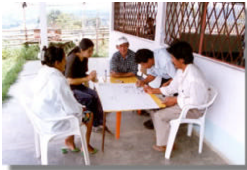
Agricultores del CIAL el UVO en el municipio Timbio, Cauca. Realizando un ejercicio de escenarios de situaciones actuales y futuras.